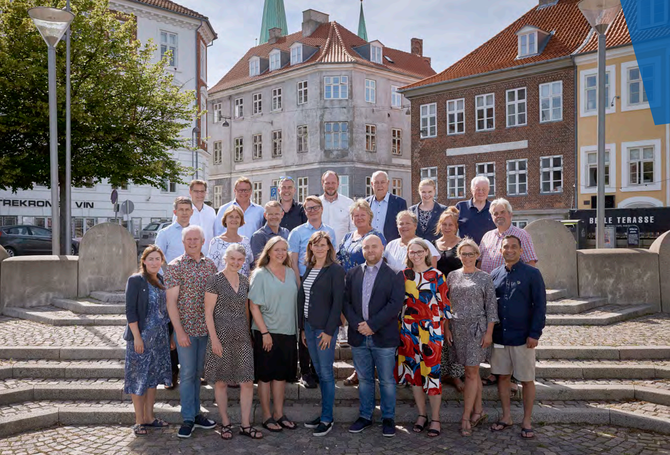
Visionen er vedtaget af byrådet den 24. juni 2019 | Design og layout: Morten Gleesen | Fotos: David Rosted